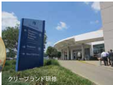
クリーブランド研修