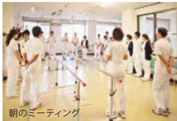
朝のミーティング