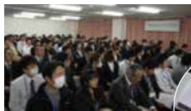
南大阪リハビリテーション学会